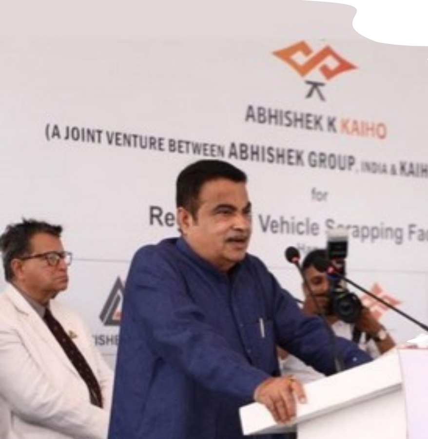
インド道路・交通・高速大臣 Nitin Gadkari氏、開所式挨拶にて