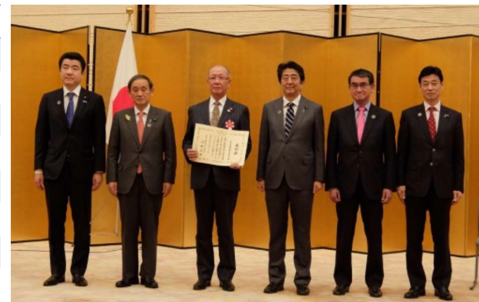
第2回ジャパン SDGsアワード外務大臣賞受賞(2018)