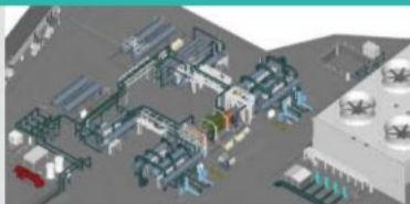
Binary Geothermal Power Generation (Philippines)/ Mitsubishi Heavy Industries Ltd.