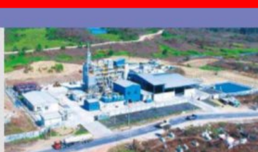
Waste to Energy Plant (Myanmar)/ JFE Engineering Corporation