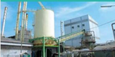
Biomass Boiler (Thailand)/ Fujii Foods Corporation