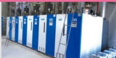
Once-through Boiler (Myanmar)/ Acecook Co., Ltd.