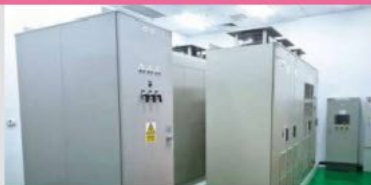
Raw Water Intake Pumps (Viet Nam)/ Yokohama Water Co., Ltd.