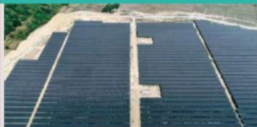
Solar Power (Viet Nam)/ Kanematsu KGK Corp.