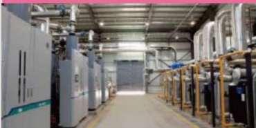
LPG Boilers (Mongolia)/ Saisan Co., Ltd.