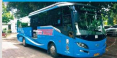
CNG-Diesel Hybrid Public Bus (Indonesia)/ Hokusan Co., Ltd.