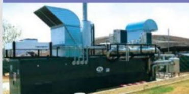
Power Generation with Methane Gas Recovery System (Mexico)/ NTT Data Institute Consulting Inc.