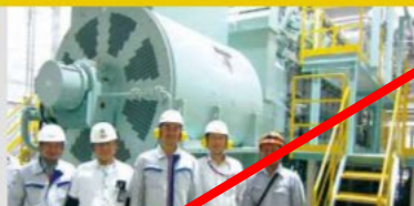
Gas Co-generation system (Indonesia)/ Toyota Tsusho Corporation