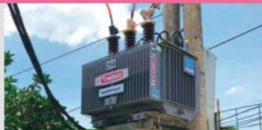
Amorphous Transformers (Viet Nam)/ Yuko Keiso Co., Ltd.