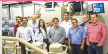
Chiller and Heat Recovery System (Costa Rica)/ NTT Data Institute Consulting Inc.