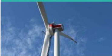
Wind Power Generation (Philippines)/ Chodai Co., Ltd.