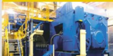
Co-generation Plant (Thailand)/ Nippon Steel Engineering Co., Ltd.