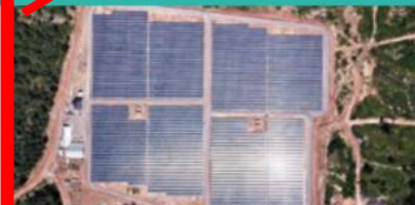
Solar Power (Lao PDR)/ Sharp Energy Solutions Corporation