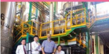
Energy Efficient Distillation System (Mexico)/ Suntory Spirits Ltd.