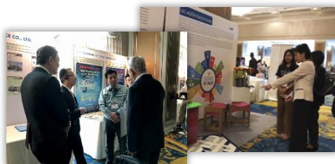
日本・タイ環境ウィーク開催時の様子