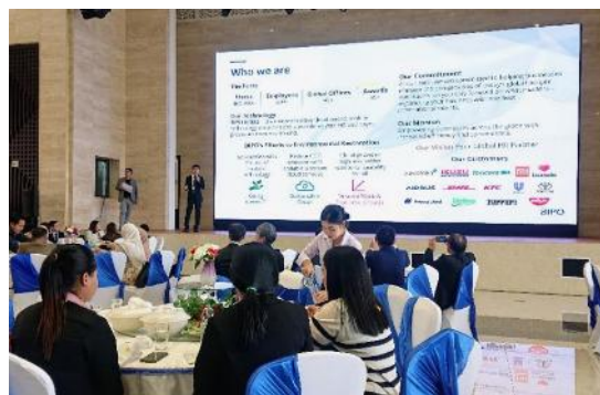
日本・ASEAN環境ウィーク開催時の様子

2024年11月22日(金)フィリピン時間16:00 (日本時間17:00) まで