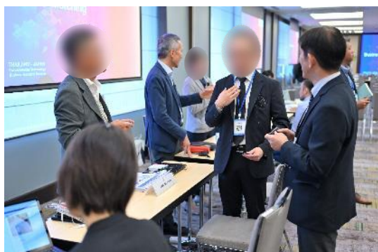
日本・タイビジネスマッチング開催時の様子