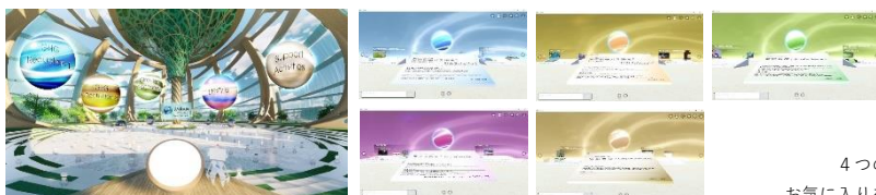
↑ヴァーチャル・ジャパン・パビリオン内のイメージ

※また令和3年3月11日(木)、12(金)には展示空間にて各企業・団体の説明員が皆さまからの質問にお答えする時間も設けています。