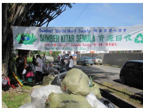
NGO の移動式資源化物回収拠点

調査時点 (2011 年 11 月) における Buy Back Center の資源化物買取価格を表 4-4 に、クアラルンプール市が発表している主な資源化物の回収実績 (2010 年) を図 4-7 に示す。