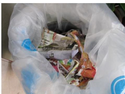
ジャンクショップへの売却等を考え、家庭で分別された資源化物（雑紙）