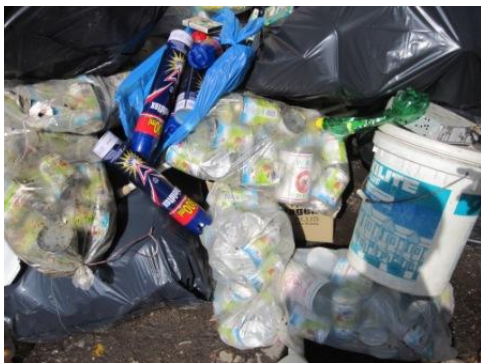
ジャンクショップに集められた資源化物 (1)