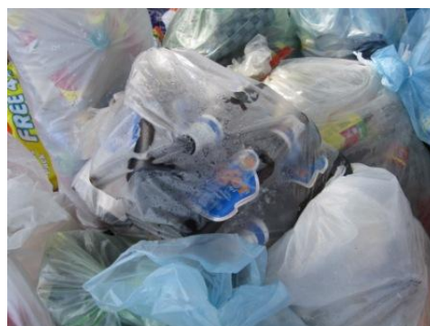
移動式資源化物回収拠点に集められた資源化物