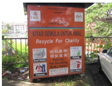
NGO が設置する Drop Off Center