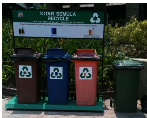
街中に設置されたリサイクルビン