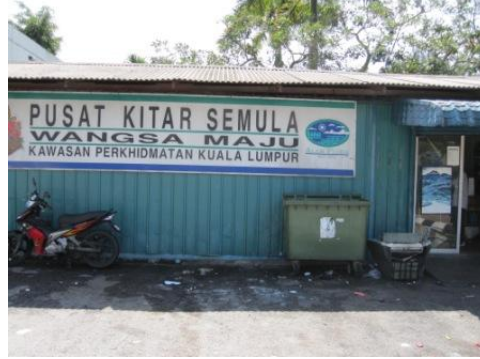
アラムフローラ社が運営する Buy Back Center