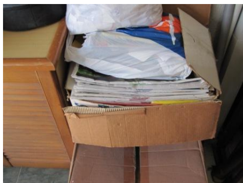
ジャンクショップへの売却等を考え、家庭で分別された資源化物（新聞）