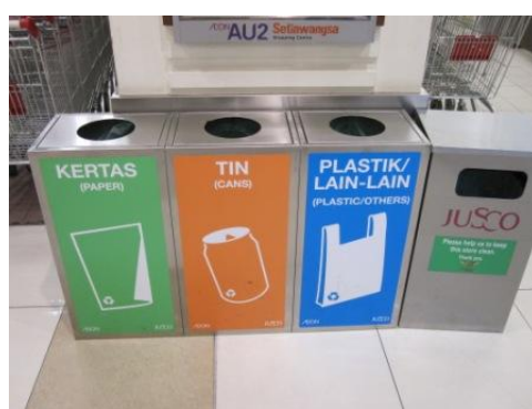
ショッピングモールに設置されたリサイクルビン