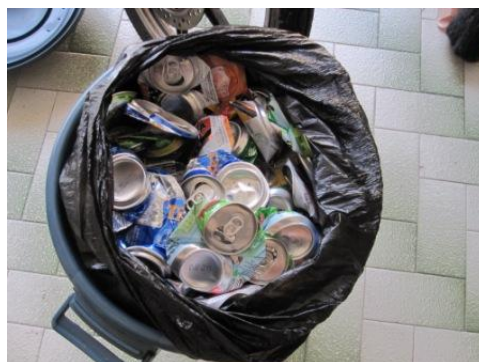
ジャンクショップへの売却等を考え、家庭で分別された資源化物（缶）