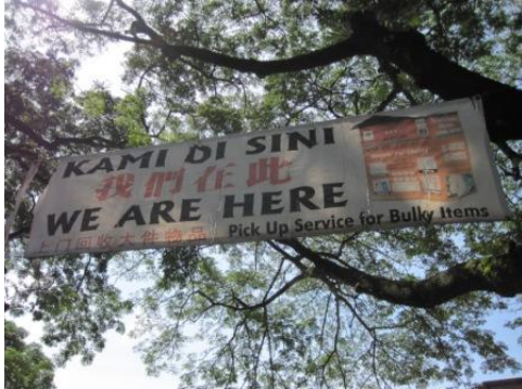
NGO が設置する Drop Off Center の場所を示す横断幕