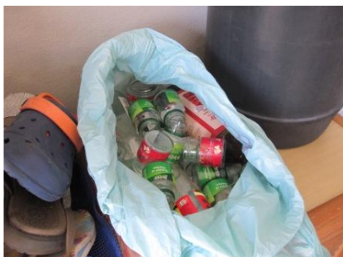
ジャンクショップへの売却等を考え、家庭で分別された資源化物（ビン）