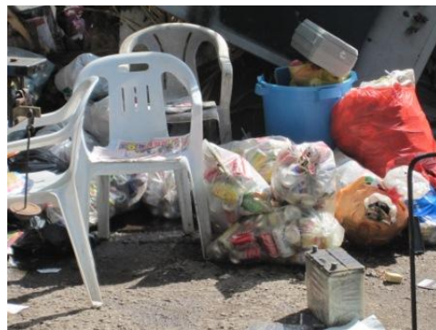
ジャンクショップに集められた資源化物 (2)