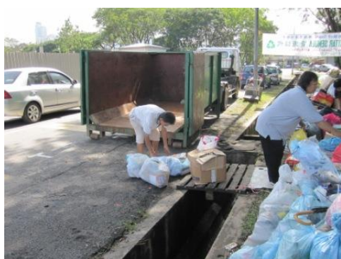
移動式資源化物回収拠点からの資源化物の運び出し