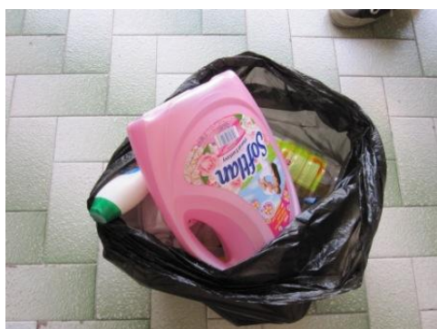
ジャンクショップへの売却等を考え、家庭で分別された資源化物（プラスチック）