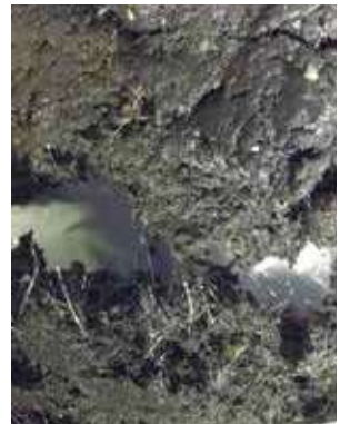
脱水助剤を投入した汚泥