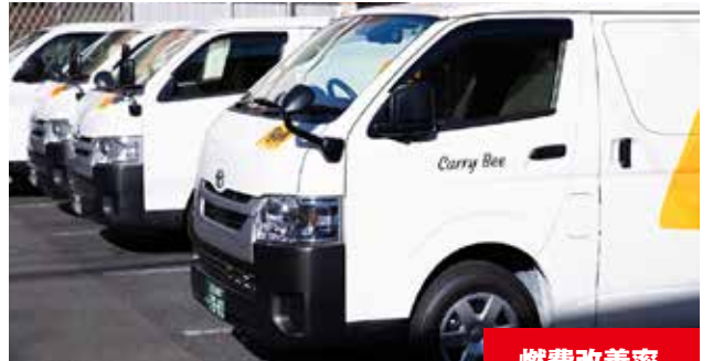
トヨタ ハイエース 2700cc/ディーゼル

eco-SPRAY使用前燃費 (1L) 5.80 km eco-SPRAY使用後燃費 (1L) 6.42 km 燃費改善率 10.67%