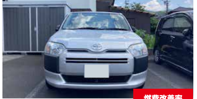
トヨタ サクシード 1500cc/ガソリン

eco-SPRAY使用前燃費 (1L) 11.89 km eco-SPRAY使用後燃費 (1L) 13.60 km 燃費改善率 14.37%