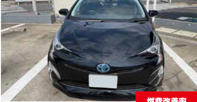
トヨタ プリウス 1800cc/ハイブリッド/ガソリン

eco-SPRAY使用前燃費 (1L) 18.6 km eco-SPRAY使用後燃費 (1L) 22.6 km 燃費改善率 21.51%