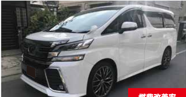
トヨタ ヴェルファイア 2500cc/ガソリン

eco-SPRAY使用前燃費 (1L) 7.45 km eco-SPRAY使用後燃費 (1L) 8.55 km 燃費改善率 14.7%