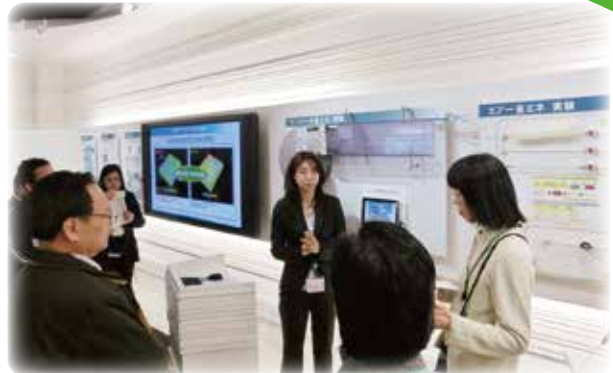
省エネルギーに配慮した工場の視察と技術指導