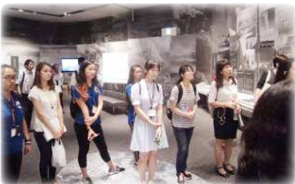
日本・中国・アメリカの高校生による環境学習交流

環境学習を通して、諸外国との交流を深めています。また、様々な国際機関、各国政府等との連携による官民パートナーシップを通じて地球温暖化対策に貢献すべく、クリーンエネルギー、再生可能エネルギー等のプロジェクトの実施を支援し、諸外国への技術移転を促進しています。