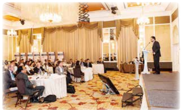
クリーンエネルギーに関するプロジェクト開発者と投資家とのマッチングフォーラム