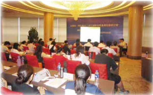
公害防止対策セミナー(中国)