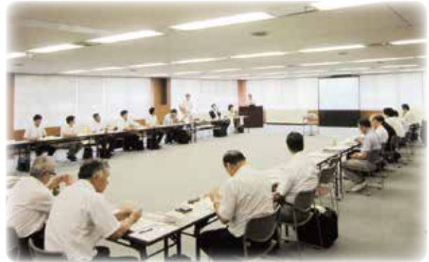
環境ビジネス技術研究会・販路開拓研究会