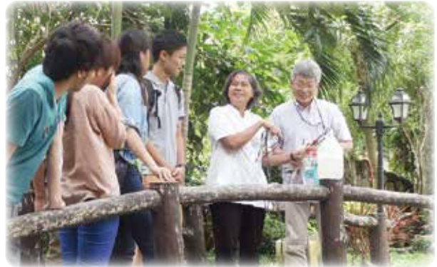
環境リーダーの育成研修(フィリピン)