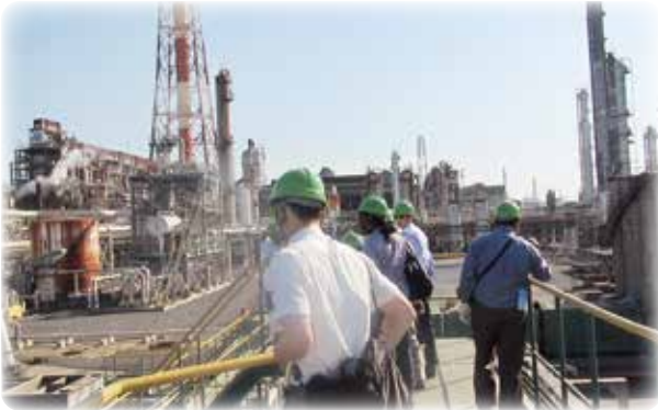
化学工場の排水処理施設の視察と技術指導

環境保全分野での人材育成を目指し、諸外国の行政官、技術者、研究者等を対象に、日本の環境保全に関する施策や技術を中心に、国内外で研修や技術指導を実施しています。また、諸外国に専門家を派遣して日本の環境施策や技術を紹介する取り組みとして、環境保全に関するセミナーやワークショップ等を開催しています。