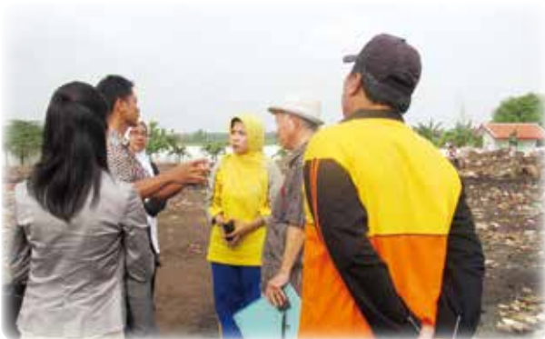
廃棄物処理の現状把握調査(インドネシア)