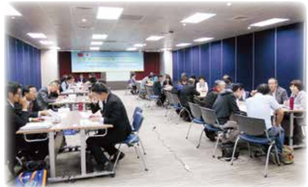
環境ビジネス商談会(台湾)