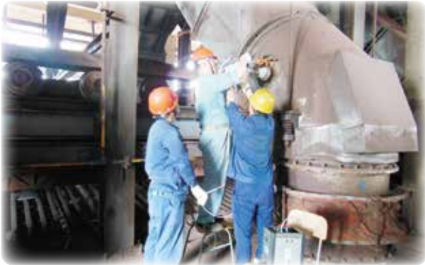
大気汚染物質排出量調査(中国)

国内外の環境保全やエネルギーに関する実態・問題点を把握する調査等を実施しています。また、環境保全技術のニーズ及びシーズ調査を行い、商談会やセミナーの開催を通じて、環境保全技術を有する日本企業の海外展開及び技術移転等を支援しています。