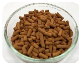
CO 2 固体回収材 (NaFeO 2 ペレット)