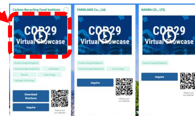
COP29ジャパン・パビリオン・バーチャル展示サイトTOP2