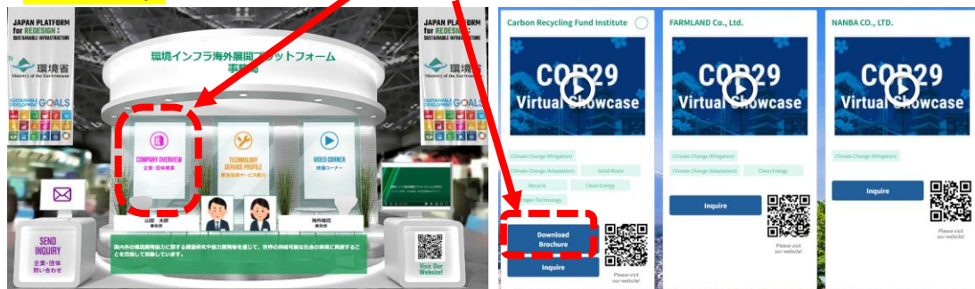
JPRSI常設オンラインパビリオン右側のモニター

パンフレットをアップロードしておくことで、訪問者がここからダウンロードできるようになります。