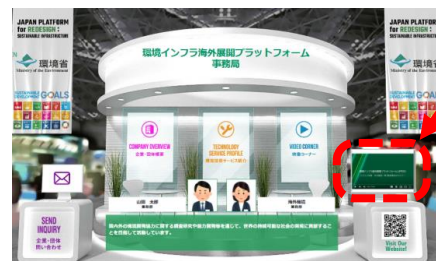
JPRSI常設オンラインパビリオン右側のモニター